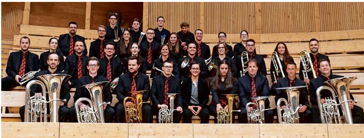
Die Brass Band Cazis begeisterte erst kürzlich mit einem Auftritt in der Bündner Arena.